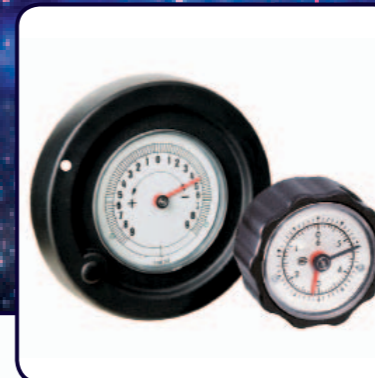
01 Seit Jahrzehnten bewährte Siko-Handräder mit Positionsanzeigen

Abgerundet wird der DKE01 durch ein säure- und laugenresistentes Kunststoffgehäuse. In Verbindung mit der Schutzart IP 65 ist die Verwendung des elektronischen