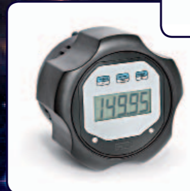
02 Elektronischer Stellknopf DKE01